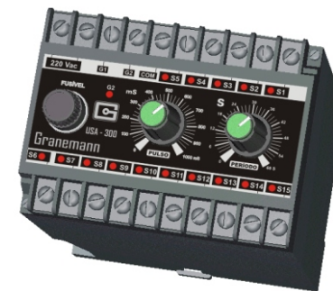
SEQÜENCIADOR 15 SAÍDAS

O Seqüenciador para filtro de mangas foi desenvolvido para atender a necessidade de limpeza via ar comprimido. Com tempos precisos o USA-300 fará esta função com maior economia. Permitindo o ajuste de tempo de duração do pulso de 300 mS ou 1000 mS e de intervalo entre um pulso e outro de 60 segundos. De fácil instalação. Visualizador de saídas individual para facilitar a manutenção.